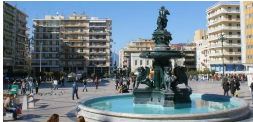
Centrul orasului-Piata George

In ziua imediat urmatoare ne-am strans toti studentii Erasmus la biblioteca facultatii pentru o prezentare a Universitatii si a imprejurimilor. Aici am intalnit studenti veniti din multe colturi ale lumii, dar si romani.